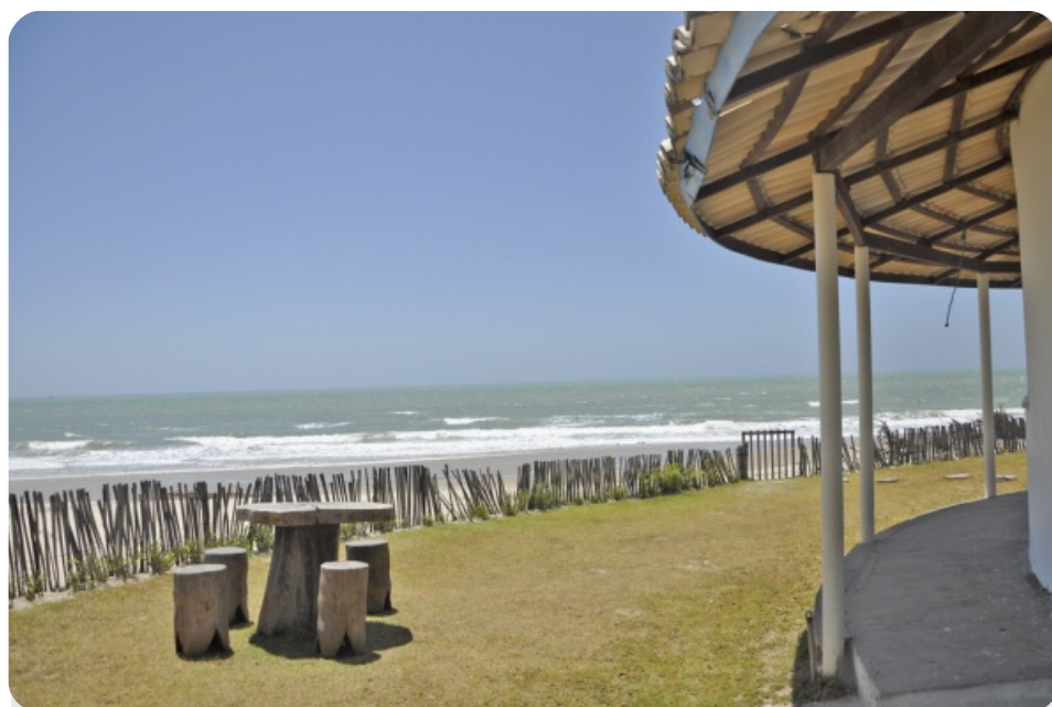
Playa de Canto Verde

Entre los retos que se nos presentan hay que fortalecer los debates y formación sobre las discriminaciones y desigualdades raciales y la lucha y organización entorno a los derechos de los pueblos y de la justicia ambiental.