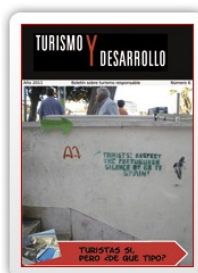
Boletín nº 6