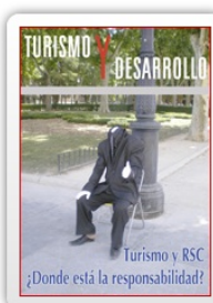
Boletín nº 7