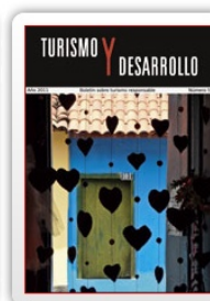
Boletín nº 5