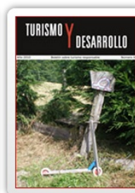
Boletín nº 4