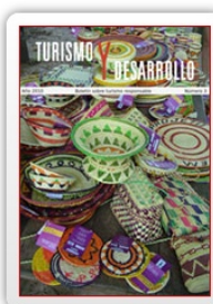
Boletín nº 3