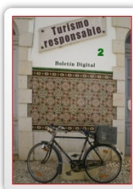
Boletín nº 2