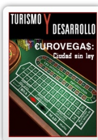
Boletín nº 8